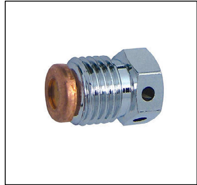
Détail d'un disque de rupture