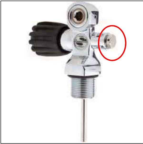
Disque de rupture monté sur une robinetterie